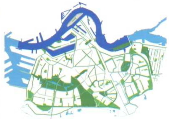
Water en groen op Zuid.

singels. Ook de aanwezige en na te streven karakteristieken van de singels zullen in woord en beeld worden vastgelegd. Voor de stadswijken is hier door bureau Quadrat al een aanzet gemaakt: In de vorm van kansenkaarten kunnen specifieke