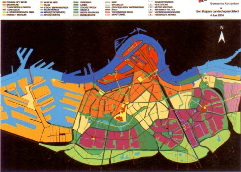
Regiekaart buitenruimte Rotterdam Zuid.

De legenda van de kaart vormt een overzicht van de belangrijkste bouwstenen van de structuur en de kwaliteit van de openbare ruimte op Zuid. Het doel is voor elke legenda-eenheid het na te streven wensbeeld te omschrijven en vast te leggen in profielen, materialen en sfeerbeelden.