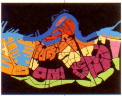
De karakteristieke deelgebieden op Zuid.

ontwikkelen kwaliteiten van de openbare ruimte worden vastgelegd. Of over de wens om de typerende hiërarchie in straatprofielen te handhaven en de samenhang van de boomstructuur met de stedenbouwkundige