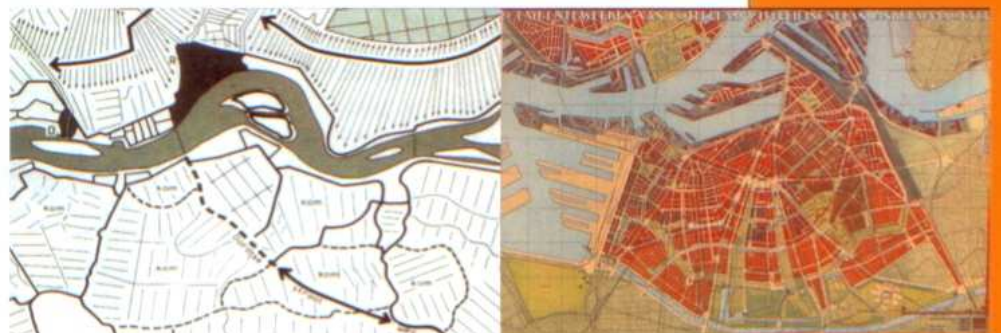
Landschappelijke ondergrond (Palmboom, 1987) en stedenbouwkundige structuren (Witteveen, 1926) als basisinformatie.

De basis voor 'Regie op Zuid' wordt gevormd door de regiekaart. Deze kaart brengt de karakteristieke eigenschappen van de openbare ruimte van Zuid in beeld in gebieden, lijnen en plekken. Zowel grote structuren zijn in kaart gebracht zoals het stelsel van lanen en singels alsook meer verborgen maar daarom niet minder belangrijke structuren, zoals het stelsel van oude dijken en linten, dat nog herkenbaar is op Zuid.