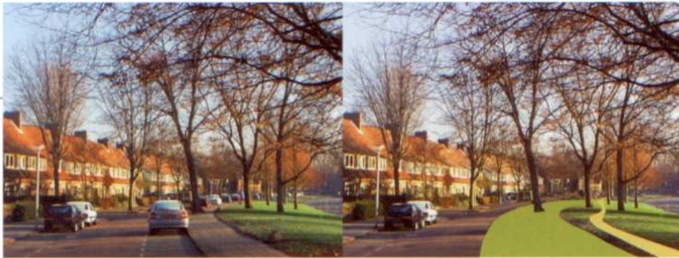
Een belangrijk streefbeeld voor de singels kan zijn het groene karakter te versterken door parkeren zoveel mogelijk te weren langs de singels en te streven naar parkpaden door het groen in plaats van trottoirs langs de rijweg.

thema's van de openbare ruimte nader worden uitgewerkt en verkend op ontwikkelingsmogelijkheden. Voorbeelden van dergelijke thematische uitwerkingen zijn kanskaarten voor uitbreiding van oppervlaktewater, recreatieve netwerken, over woonmilieu's en de betekenis van plekken als domein voor bewoners van een wijk en van de stad. Door middel van een kanskaart wordt een integrale benadering van een thema nagestreefd in plaats van een puur sectorale. De kansen die een thema biedt om de kwaliteit van de openbare ruimte als geheel te verbeteren worden in kaart gebracht.