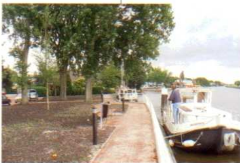
Aanlegkade voor plezierboten aan de Gouwe.

Voorwaarden voor de herinrichting van de Nesse tot een 'horecaboulevard' was de bereidheid van de horecaondernemers om een convenant te sluiten met de gemeente over beheer en gebruik van de terrassen. Zo zijn er richtlijnen opgesteld voor de keuze van terrasmeubilair (geen kunststof kuipstoelen), de opslag van meubilair (niet opgestapeld op het terras) en worden er uniforme transparante terrasschermen geplaatst zonder reclame. Ook parasols zijn terughoudend in kleurgebruik en reclame. Over het schoonhouden van de terrassen zijn afspraken gemaakt. En de ondernemers dragen